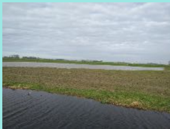
Plas dras in Crangeweer

Akker- en weidevogelvrijwilligers zijn van harte uitgenodigd voor een veldexcursie in Crangeweer. Dit is een weidevogelgebied waar beheerders met zwaar beheer, zoals 3 plas drassen en leveren van een inzet voor goed kruidenrijk grasland als voedselbron voor vogels, een aantrekkelijke biotoop scheppen voor weidevogels. We worden ontvangen in de schuur van een van de beheerders. Na een introductie in weidevogelbeheer gaan we op een platte kar het veld in om dichtbij en toch op een veilige afstand zelf te ervaren wat het effect is van het beheer.